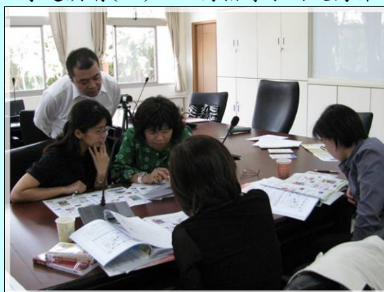
專題演講(二)－教師互動觀摩剪影