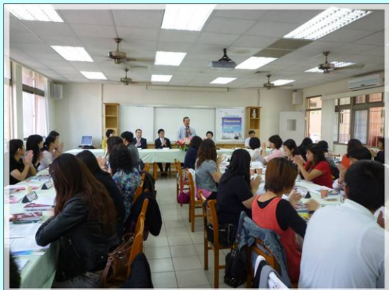
開幕式－嚴校長致詞