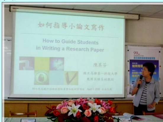
專題演講(一)－如何指導小論文寫作