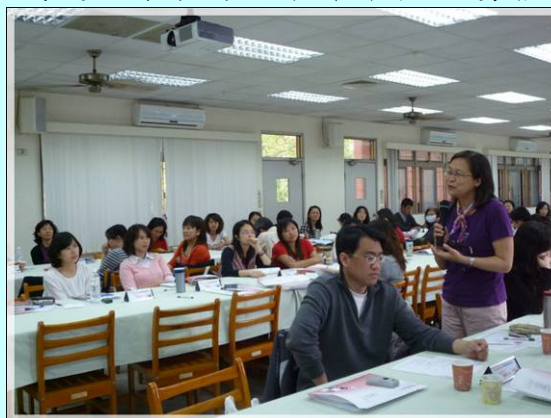
意見交流 & 結業式 活動剪影