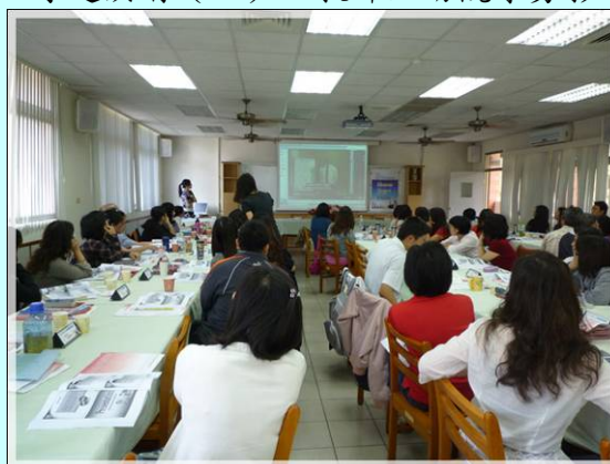
專題演講(三)－教師研習活動剪影