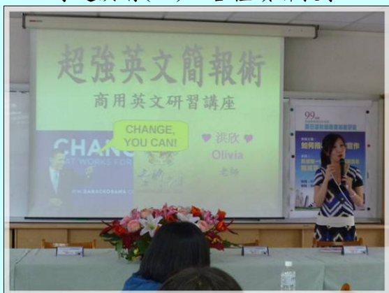
專題演講(三)－超強英文簡報術