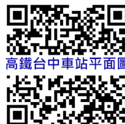
高鐵台中車站平面圖