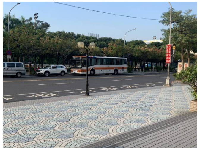
↑ 集合後統一於站前路臨停處上車