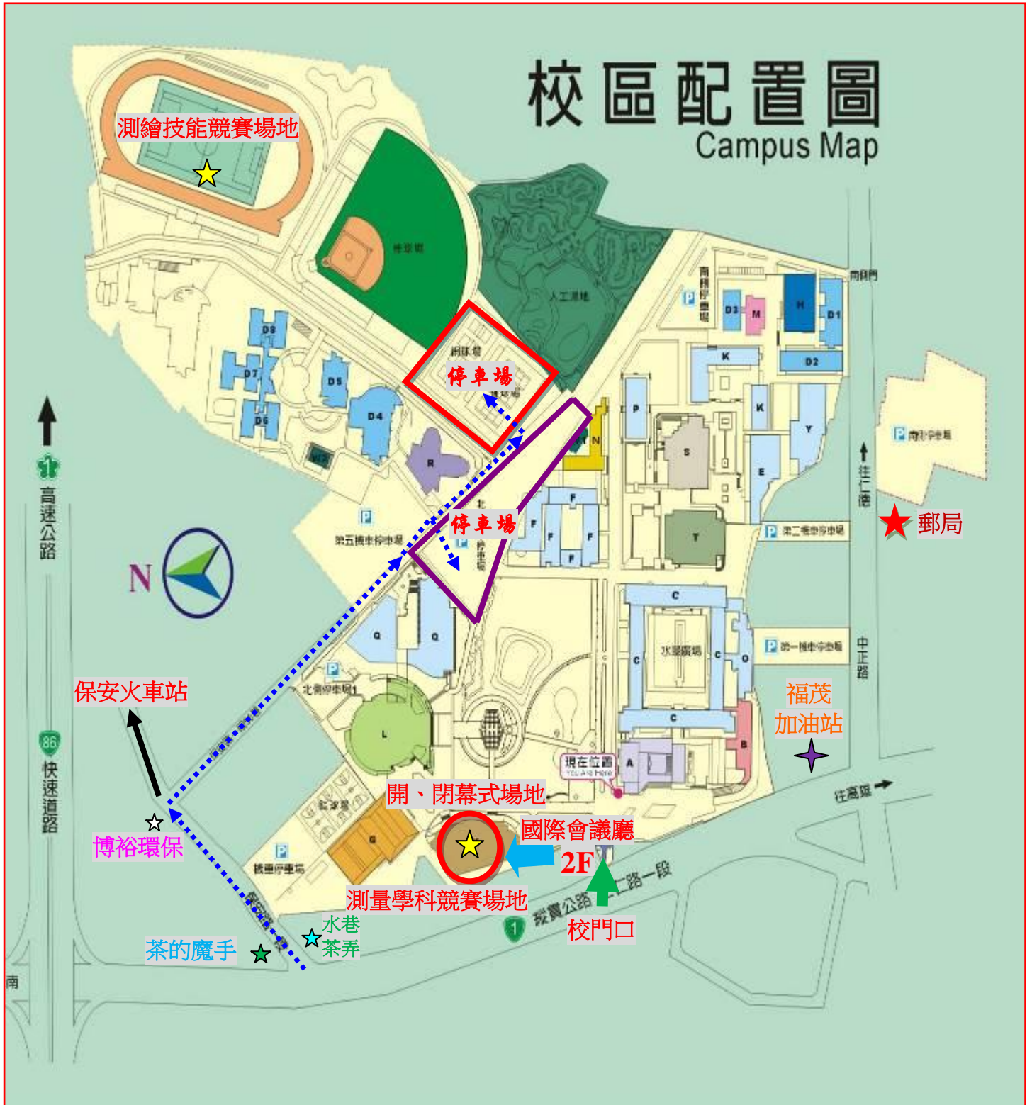
第七屆測繪技能競賽校區暨路線指示圖