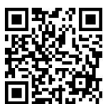
監評人員申請報名表