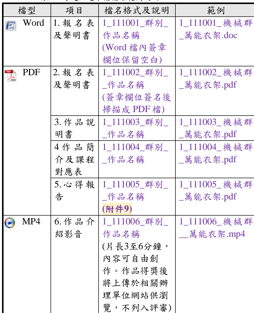
表1-2 專題組電子檔檔名範例說明