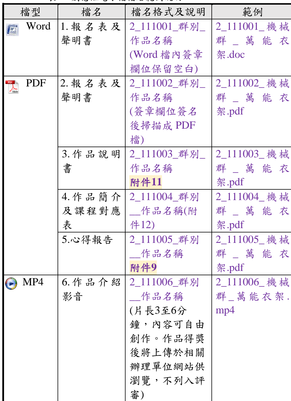
表1-4創意組電子檔檔名範例說明